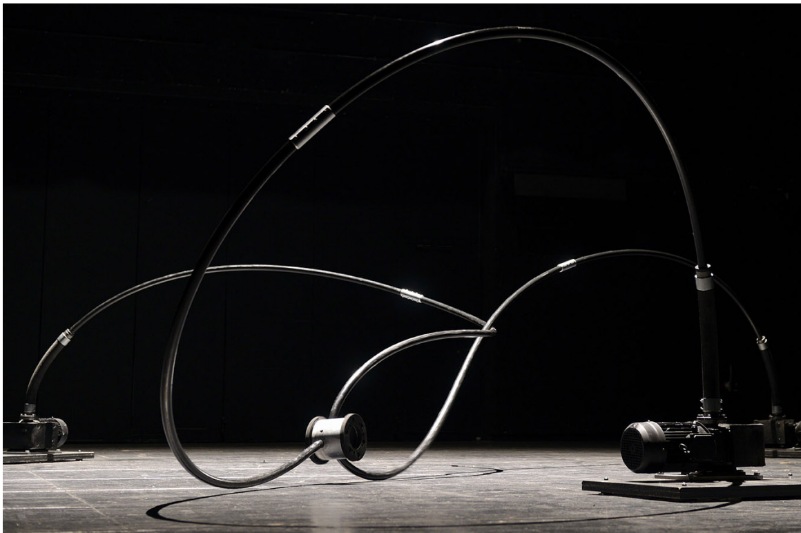
installation performative / 2013

Nyloïd est une impressionnante sculpture sonore, un tripode géant composé 3 tiges de nylon de 6 mètres de longueur animées par un dispositif mécanique et sonore sophistiqué. A la fois sensuel et menaçant, ce mobile aux allures bestiales puise sa puissance dramatique dans la réactivité de sa matière plastique et sonore aux diverses sollicitations mécaniques. Un objet vivant, dont on croit ressentir la tension, l'effort et la souffrance se dégageant de ses contorsions et ses manifestations vocales.