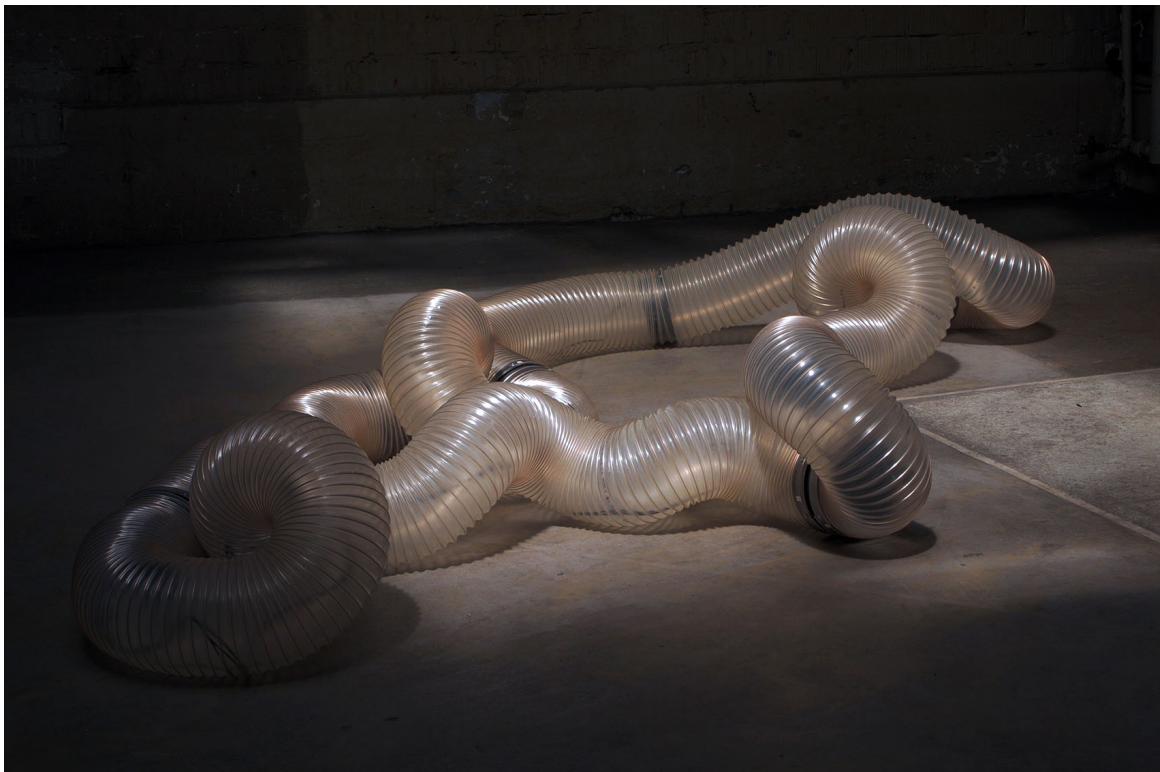
installation sonore / 2017

\pi Ton/2 est une installation sonore qui s'inscrit dans la continuité des recherches de Cod.Act sur l'organicité mécanique et sonore. Elle résulte d'une expérience sur la déformation d'une forme élastique et son incidence sur l'évolution d'une œuvre instrumentale.